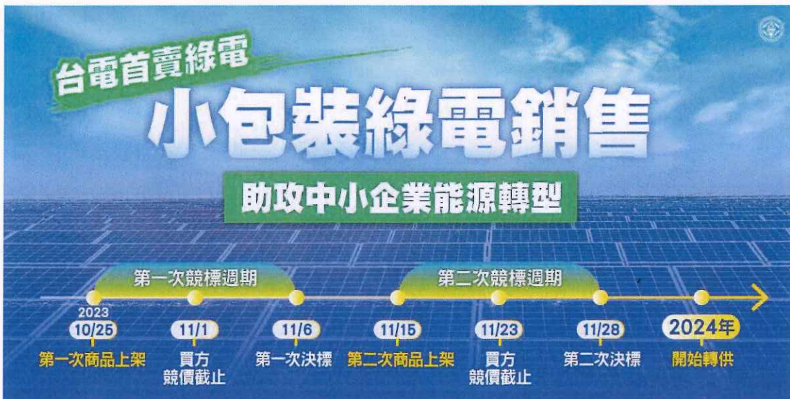
台電公司小額綠電標售期程

國際淨零碳排趨勢日漸抬頭，國內企業對綠電及憑證之採購需求快速攀升，經濟部標準檢驗局(下稱標準局)為協助綠電暨憑證供需雙方交易，提出多元解決方案，訂定「國營事業案場再生能源電力及憑證媒合服務作業程序」，並於國家再生能源憑證中心(下稱憑證中心)官網打造嶄新「綠電競標區」，與台灣電力股份有限公司(下稱台電公司)合作，台電公司推出之「小額綠電銷售試辦計畫」使用。台電公司規劃年底前於標準局憑證中心綠電媒合平台上架 5,000 萬度自建綠電供企業競標，歡迎各企業參與競標購買綠電。